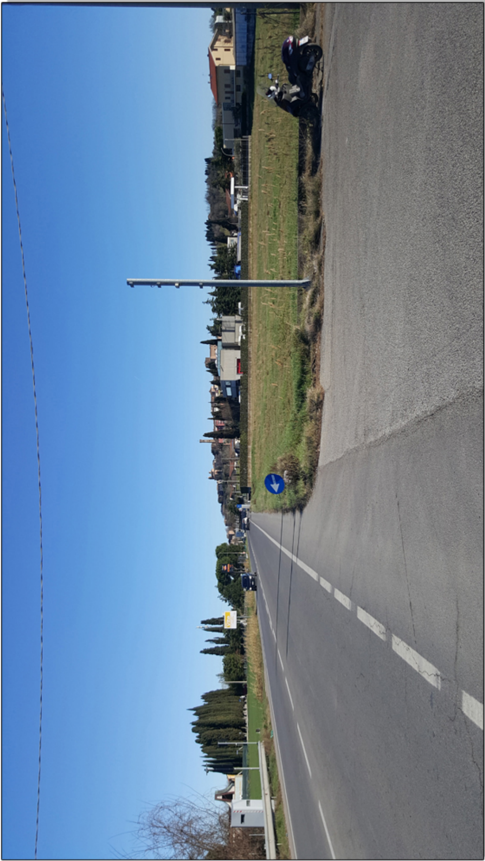
VISTA DIREZIONE RIMINI DA VIA EMILIA - STATO DI FATTO