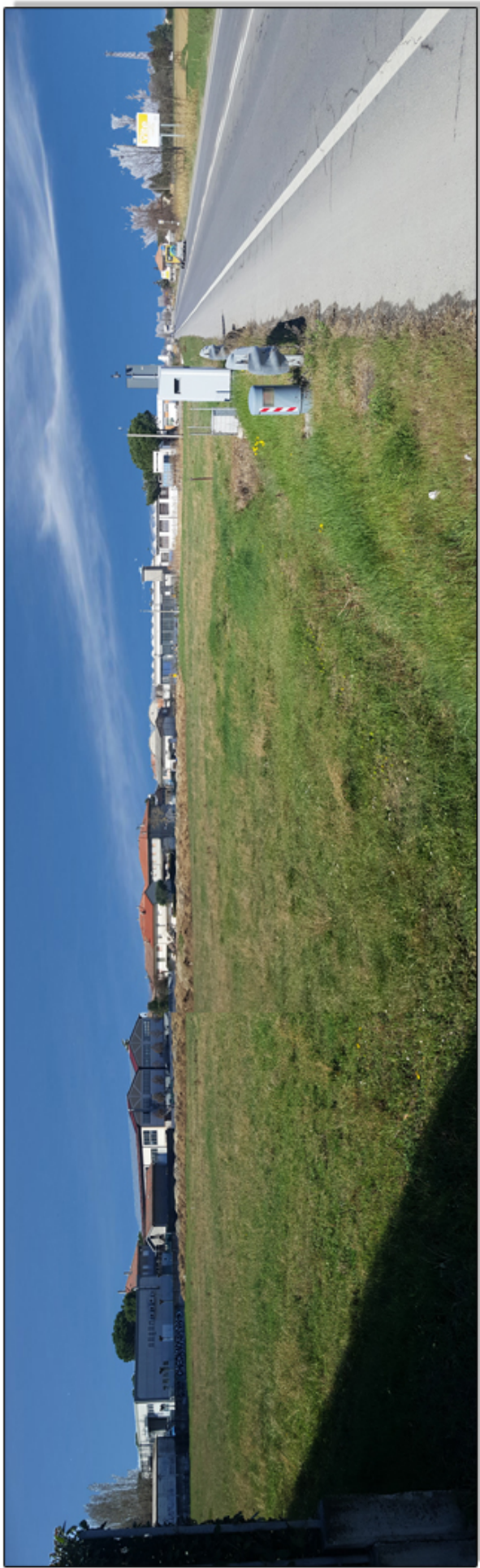
VISTA DIREZIONE SAVIGNANO DA VIA EMILIA - STATO DI FATTO