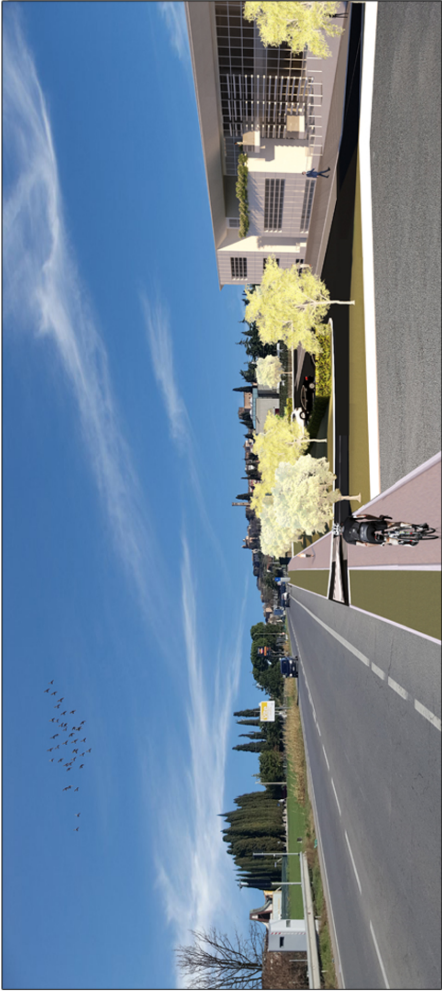
VISTA DIREZIONE RIMINI DA VIA EMILIA - PROGETTO