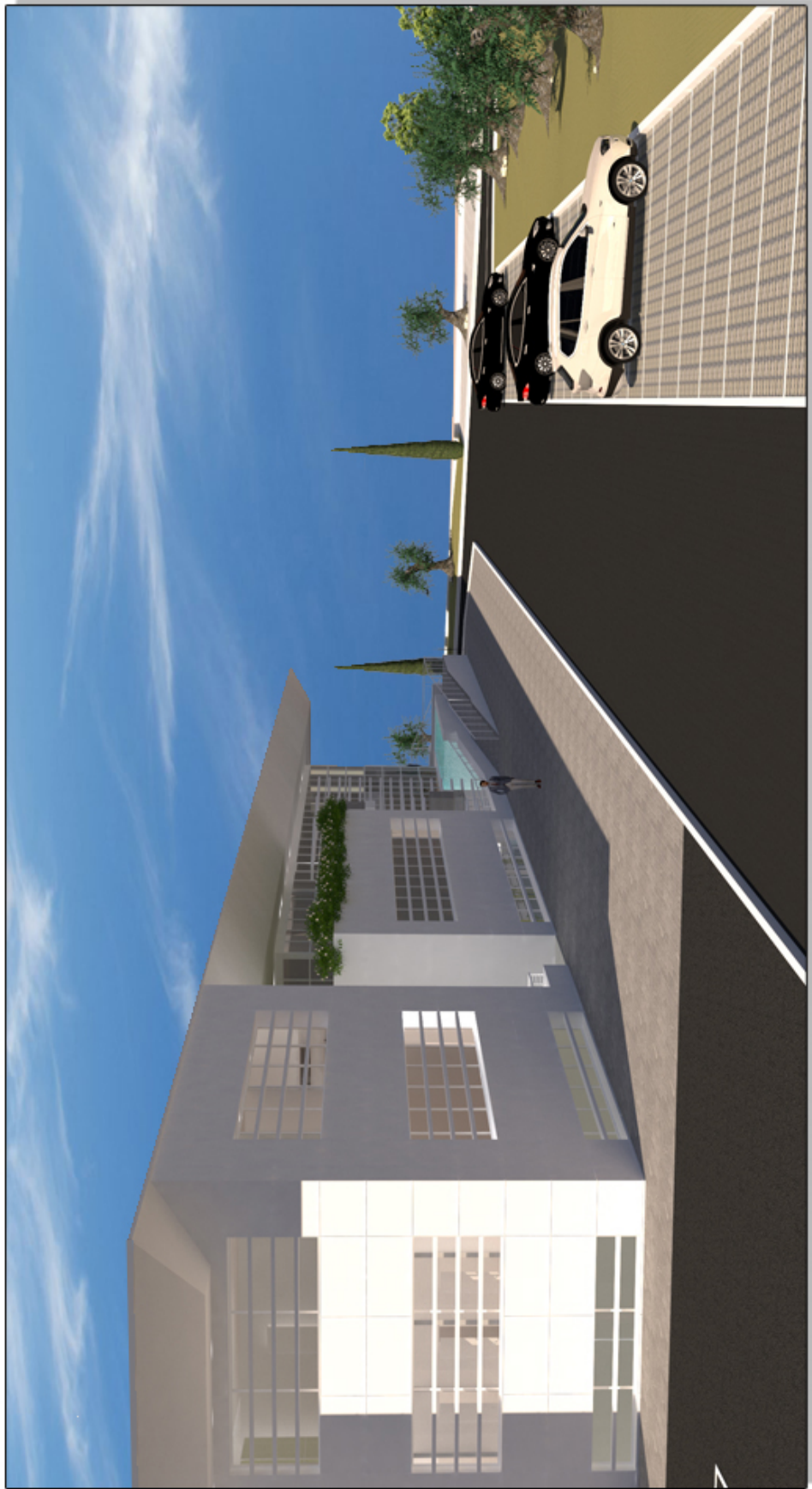
VISTA RAMPA D'INGRESSO