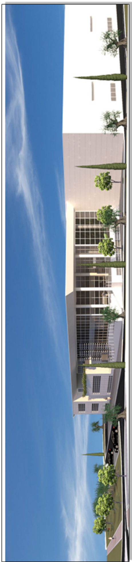
VISTA GENERALE LATO NORD