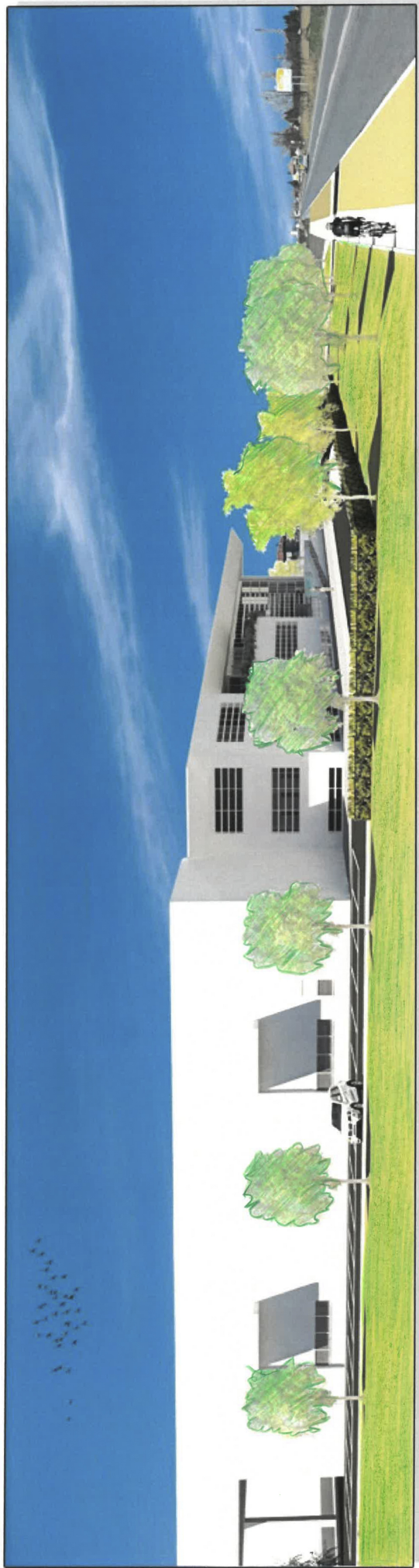
VISTA DIREZIONE SAVIGNANO DA VIA EMILIA - PROGETTO